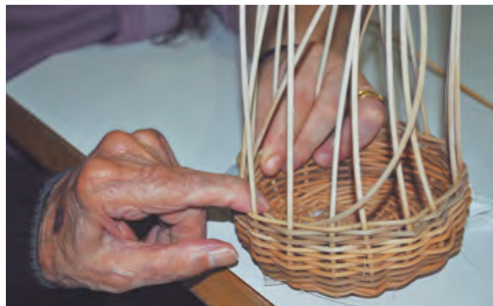
Taller de manualitats.