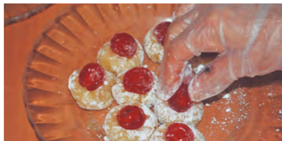
Taller de penellets.