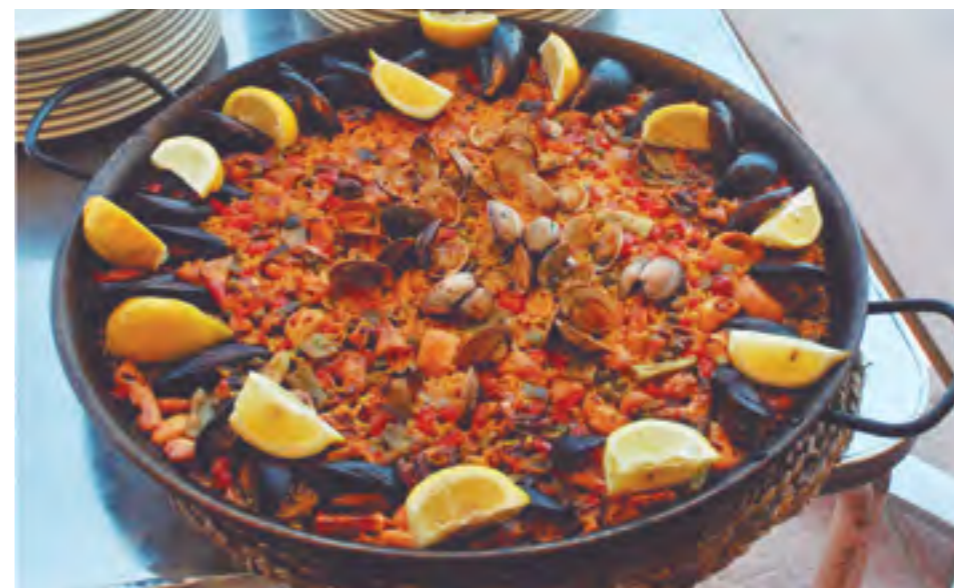
Sortides per a menjar paella a les guinguetes de Poblenou.