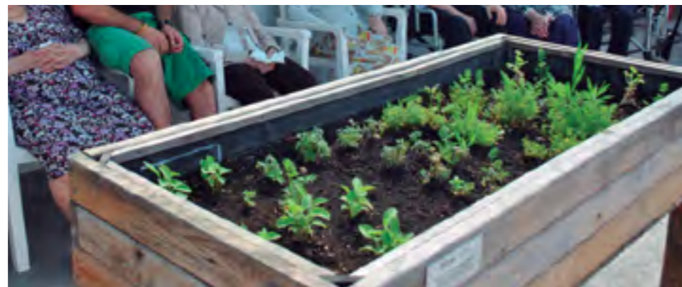
Taller d'hort urbà.

café, sortides per banyar-se a la platja, sortides de dia sencer i estades d'estiu, cinema, taller d'actualitat i lectura, d'entre d'altres.